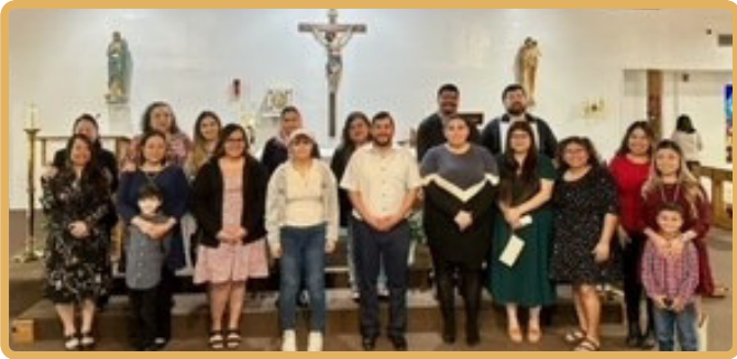
They have accepted to join our Catholic Faith